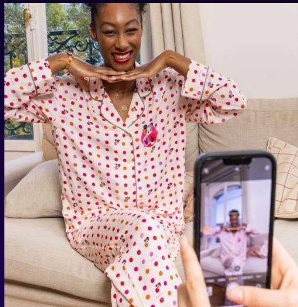
NIEUWE Minnie Paris collectie